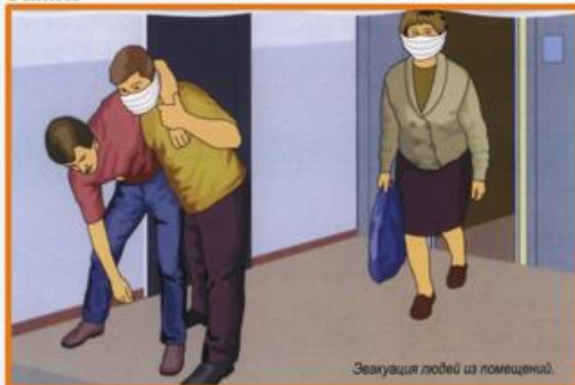
Эвакуация людей из помещений.

Очень важно действовать быстро и сноровисто ! Если Вы видите, что ликвидировать возгорание своими силами не удастся, больше ничего не предпринимайте и немедленно уходите сами.